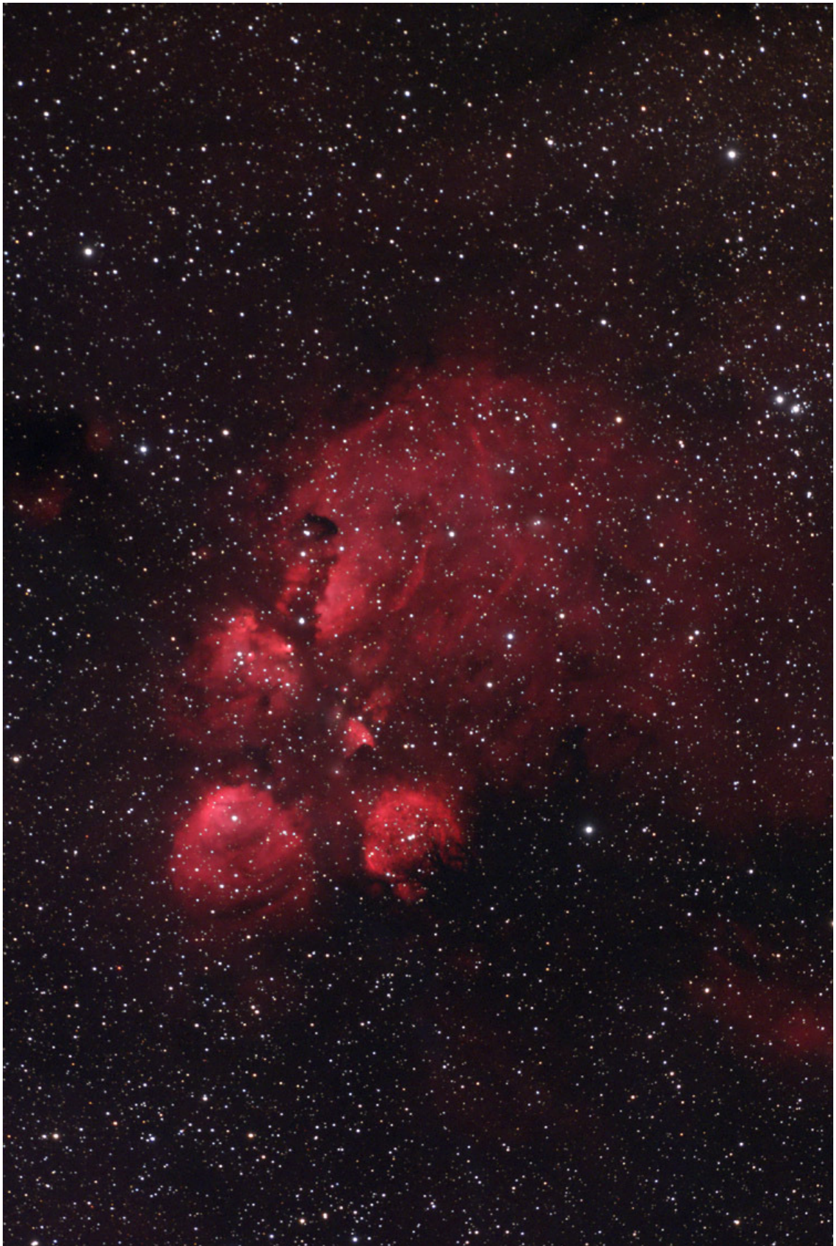
Und weil er so schön ist und weil er einer meiner Lieblingsnebel ist hier ganzseitig: „Cat Paw – NGC6334“, der Katzenpfotennebel. Gut, dass die Katze nicht echt ist – sie wäre viele Lichtjahre groß (QSI583wsg und APO bei 525mm Brennweite).