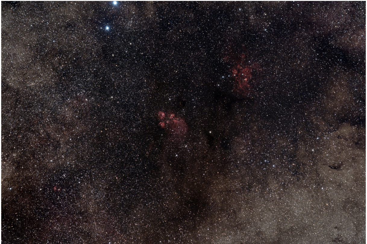
NGC6334 (Katzenpfotennebel) und NGC6357 (Krabbennebel oder „Krieg- und Friedenenebel“), mitten in der Milchstraße. Offensichtlich liegen die beiden Emissionsnebel vor einer Dunkelwolke (Canon EOS 60Da und 150mm Teleobjektiv, Norden ist rechts).