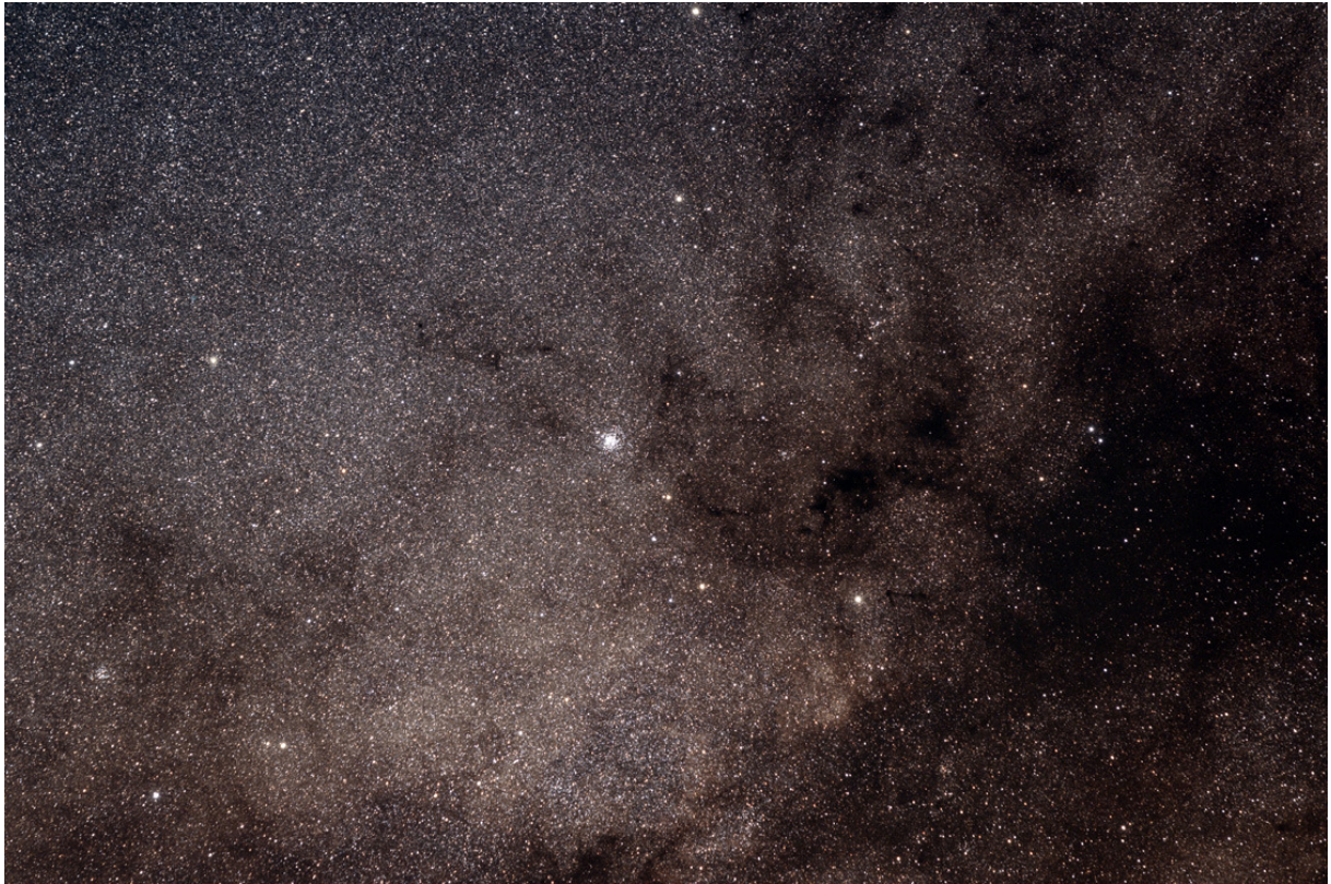
Der „Wildentenhaufen“ M11 in der Mitte und daneben die großer Dunkelwolke Barnard111 im Sternbild „Schild“ (QSI583wsg und APO bei 525mm Brennweite, Norden ist rechts).