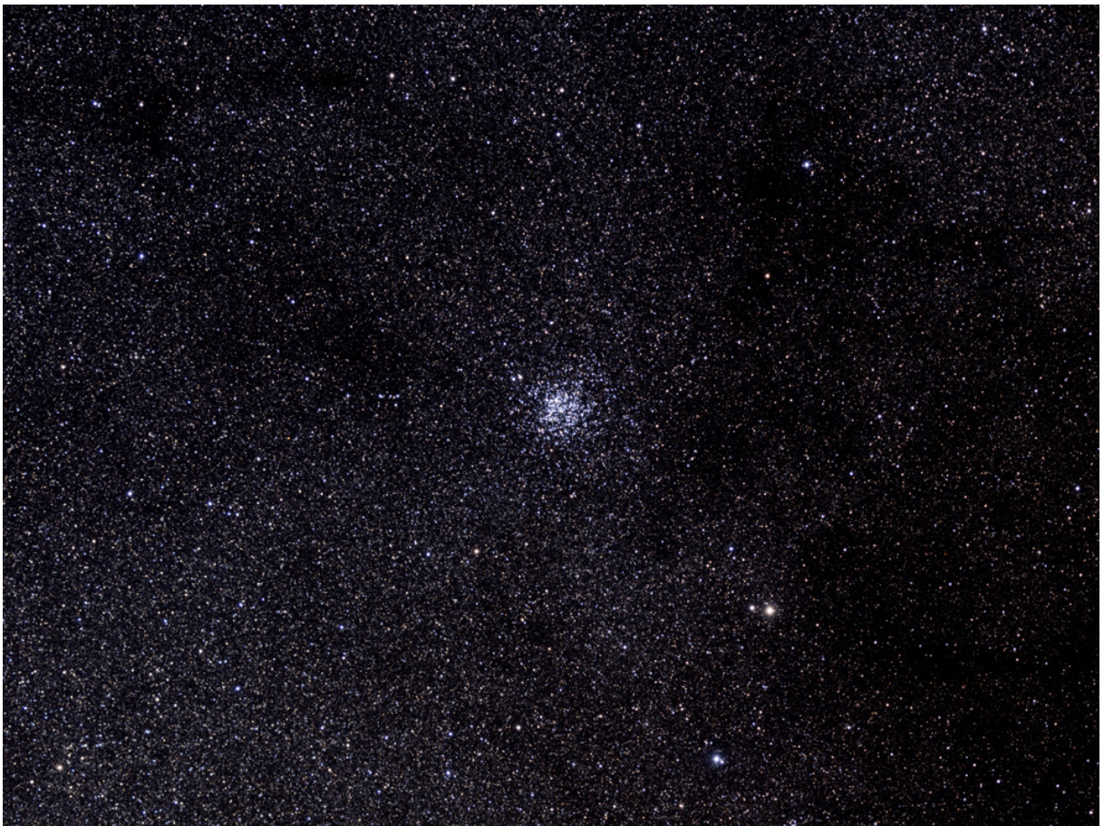
Der „Wildentenhaufen“ M11, ein sehr kompakter offener Sternhaufen, im Detail (QSI583wsg und APO bei 525mm Brennweite, Norden ist rechts).