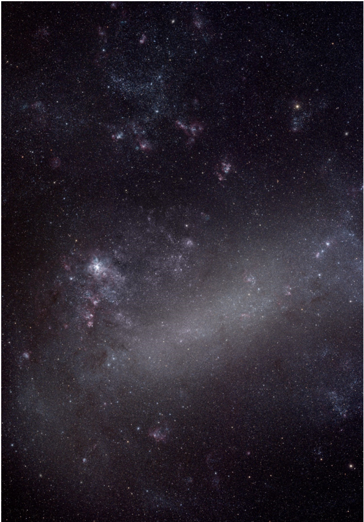
Die Große Magellansche Wolke, die größte Begleitgalaxie der Milchstraße und Mitglied der lokalen Galaxiengruppe (Canon EOS 60Da und APO bei 525mm Brennweite – Mosaik aus 14 Aufnahmen)

Das Mosaik hat im Original eine Größe 9028x12973 Pixel und 791 Megabyte. Damit verweigert manch ein Rechner bei der Bearbeitung die Zusammenarbeit. Geplant habe ich einen Papierabzug auf 105x140cm für eine geeignete Stelle bei mir zu Hause. Die Auflösung beträgt dann noch 237DPI.