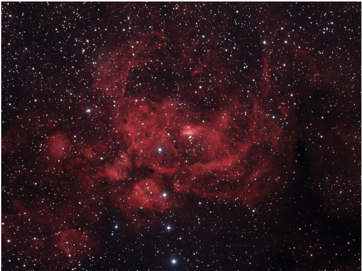
NGC6357 aus dem Bild zuvor oben rechts im Detail (QSI583wsg und APO bei 525mm Brennweite; Ausschnitt).