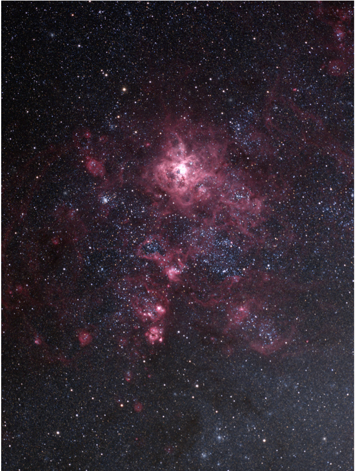
NGC2070, der berühmte Tarantelnebel, ein Emissionsnebel in der Großen Magellanschen Wolke. Sehr schön kann man die Sterne durch den Nebel „hindurch“ leuchten sehen (QSI583wsg und APO bei 525mm Brennweite).

Bei den folgenden Bildern von NGC6188, NGC6334 & NGC6357 sowie M11 habe ich neben dem Objekt dessen Umgebung parallel aufgenommen. Die Übersichtsaufnahme der Spiegelreflexkamera mit dem Teleobjektiv zeigt die Umgebung von Emissionsnebeln und Sternhaufen in der Milchstraße und ihre Einbettung in die Sterne und Dunkelwolken der Umgebung. Die Aufnahme der Astrokamera am APO-Refraktor darunter zeigt die Objekte im Detail.