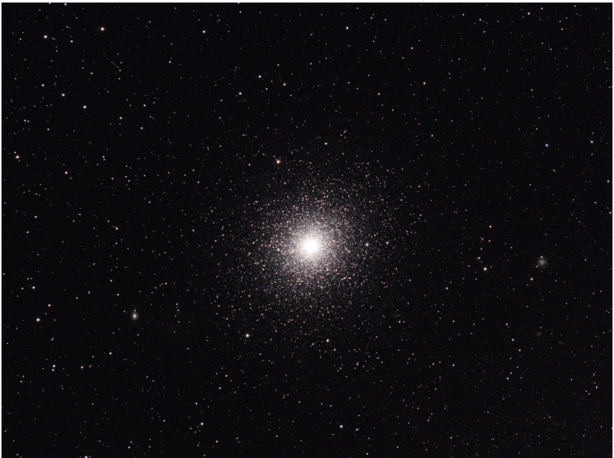
Ein echter Schönling! Der Kugelsternhaufen NGC104 (47Tucanae). Links der kleine Kugelsternhaufen NGC212, rechts die Galaxie PGC260239 (QSI583wsg und APO bei 525mm Brennweite).