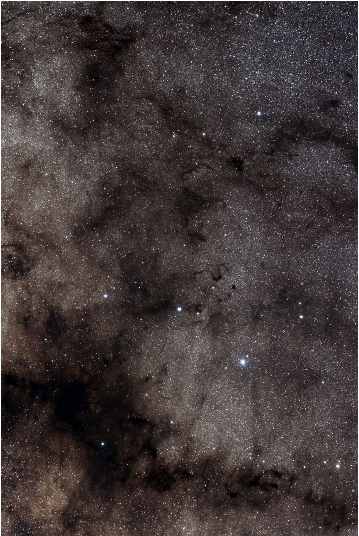
Zum Schluss: Dunkelwolken vor dem Band der südlichen Milchstraße im Sternbild Ophiuchus. Der Pfeifenkopfnebel (Barnard59/65-67/77-78) am unteren Rand des Bildes, in der Mitte Barnard72 „The Snake“, sowie etliche andere von Barnard katalogisierte Dunkelnebel (Canon EOS 60Da und 150mm Teleobjektiv).