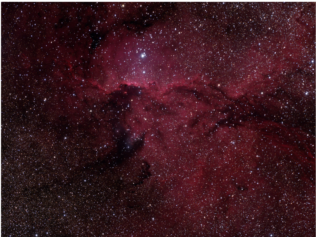
NGC6188, manchmal auch „The Great Wall“ genannt (QSI583wsg und APO bei 525mm Brennweite, Norden ist rechts).